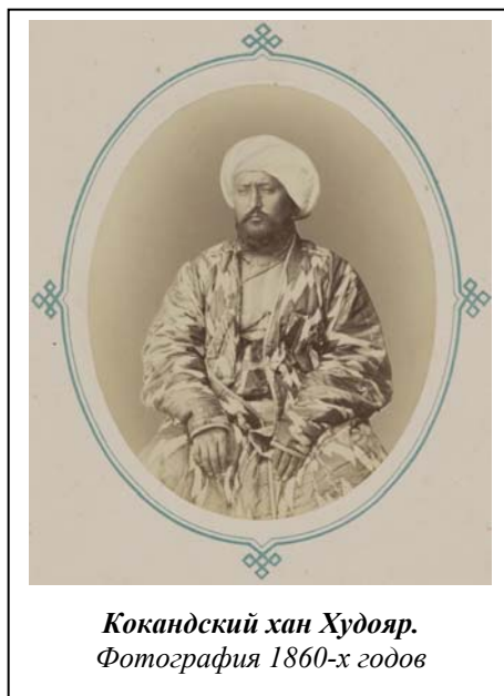
Кокандский хан Худояр. Фотография 1860-х годов